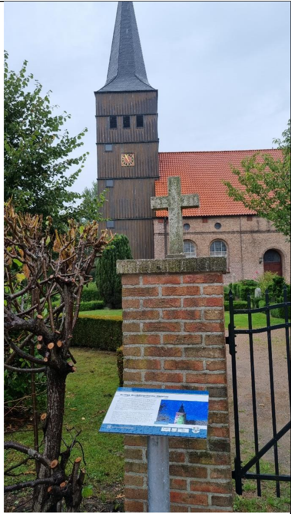
Einige Beispiele der Infotafeln / Fotos: Amt Geest und Marsch Südholstein