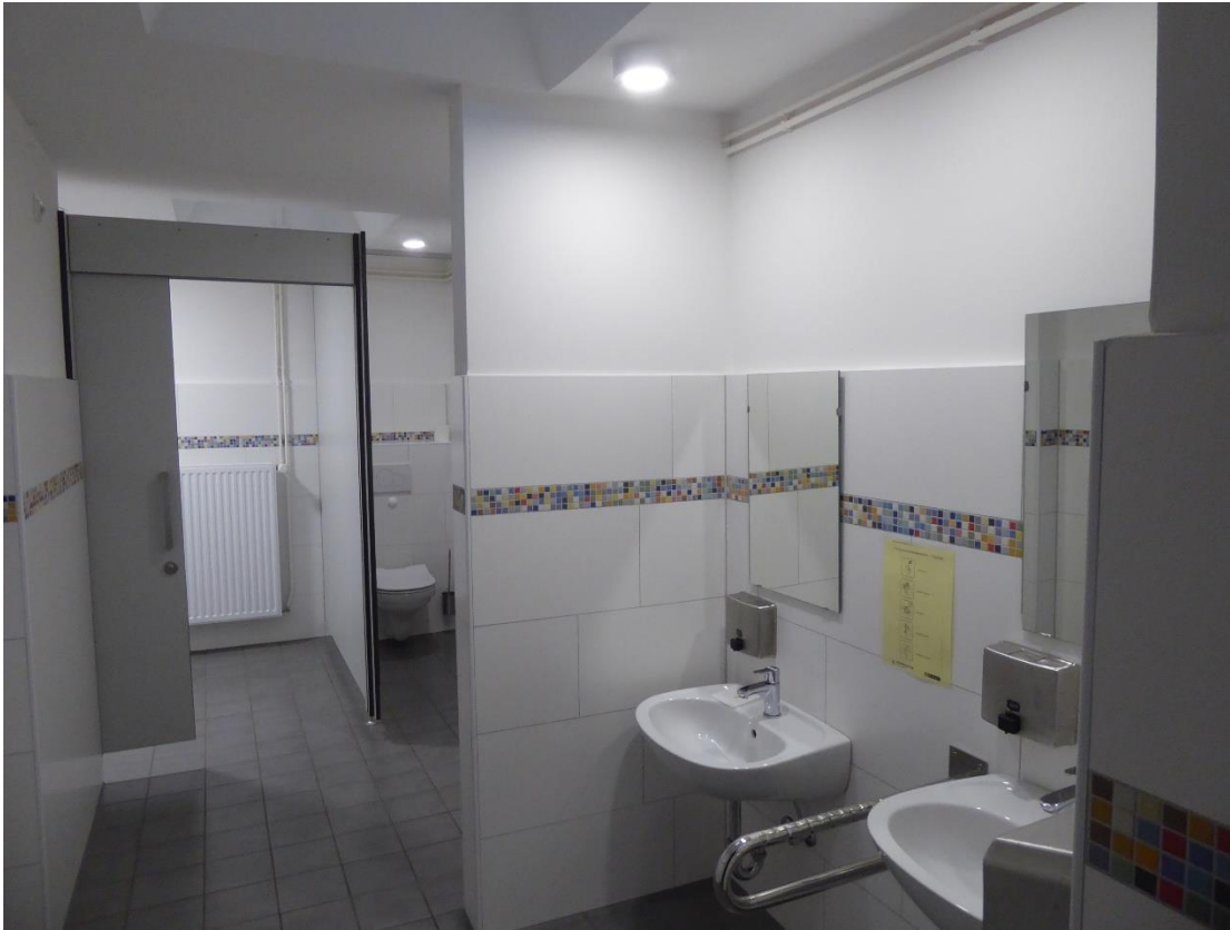
Blick in den Sanitärtrakt