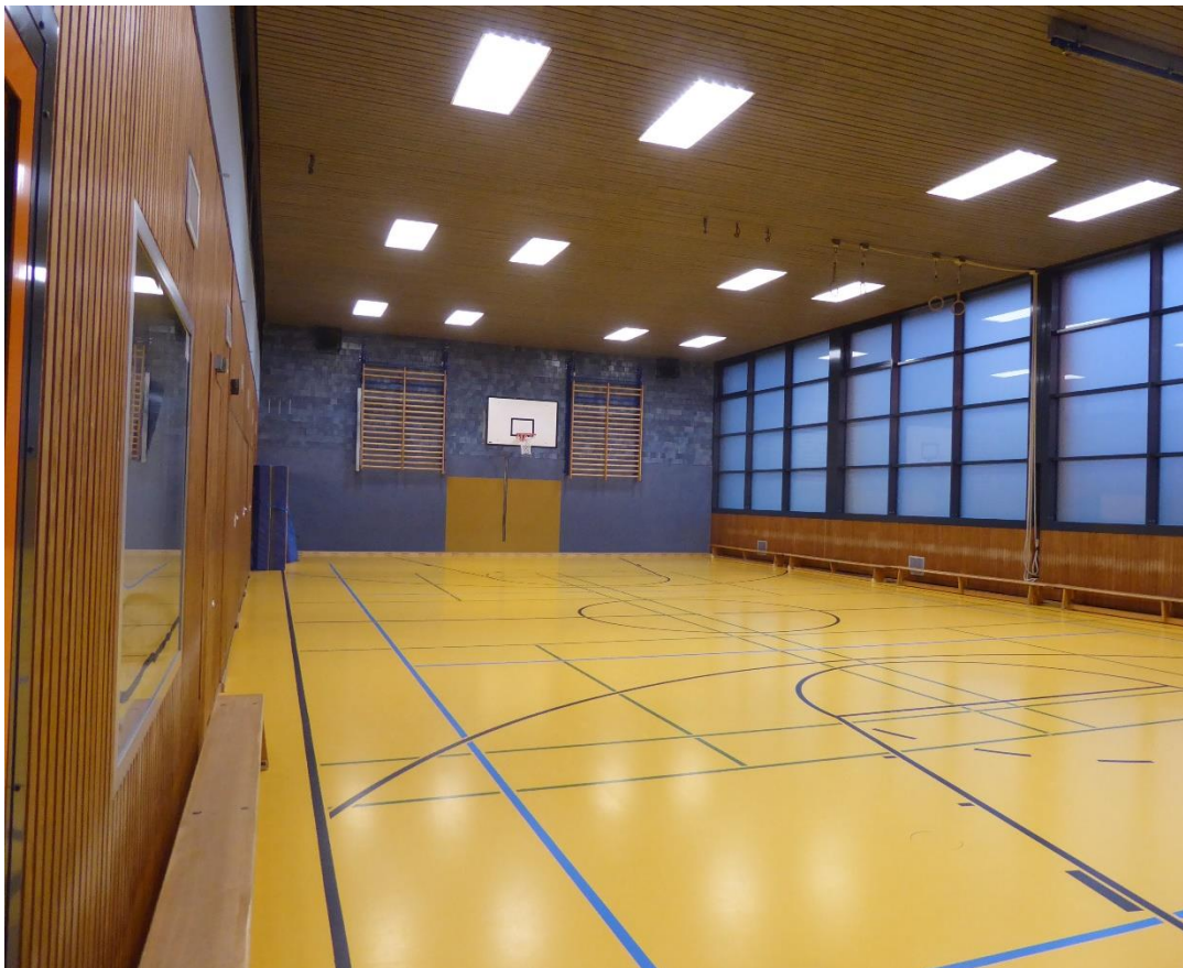
Blick in die Sporthalle