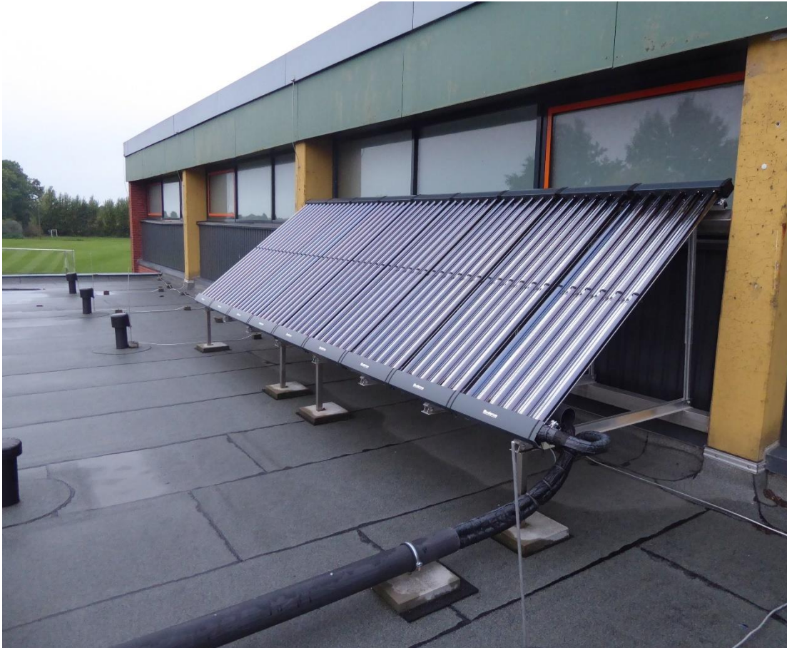
Warmwasseraufbereitungsanlage auf dem Dach